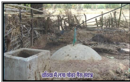
चचिया में लगा गोबर गैस संयंत्र

xzke pfp;k esa ek= 7 gtkj :i;s dh ykxr ls xkscj xSl la;a= dk fuekZ.k fd;k x;k ftlls Hkkstu idkus gsrq ydM+h dh fpark ls eqfDr feyh rFkk xSl ls Hkkstu idkuk izkjaHk gqvk vkSj mlls feyus okyh [kkn dk mi;ksx ICth ckM+h esa dj vf/kd mUur Qly dk mRiknu izkjaHk fd;k x;kA