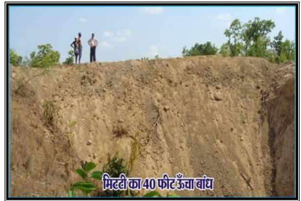
छवि 1: मिट्टी का ४० फीट ऊँचा बांध

vkfJr xzke rkjbZekjMhg ds fdukjs fLFkr chtk[kjkZ ukyk esa dbZ ckj xzkeh.kksa }kjk ftyk iz'kklu ls cka/k fuekZ.k dk vkosnu fd;k x;k lkFk gh ty lalk/ku foHkkx }kjk 40 ls 50 yk[k :i;s dh ykxr ls Hkh cka/k fuekZ.k esa vlgefr n'kkZ;hA tyxzg.k fe'ku dh Vhe }kjk fujh{k.k ds mijkar mDr ukys esa dspesaV nwj gksus ds lkFk gh ukys dh xgjkBZ 45 QhV gksus ij Hkh ca/kku ds laca/k esa xzkeh.kksa dh cSBd ysdj vko';d ppkZ dh rFkk xzkeh.kksa dks iwjh fu"Bk o