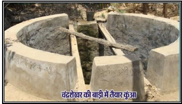
चन्द्रशेखर की बाड़ी में तैयार कुंआ