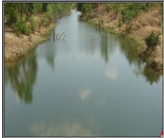
छवि 3: परियोजना के अंधर निर्मित नाला