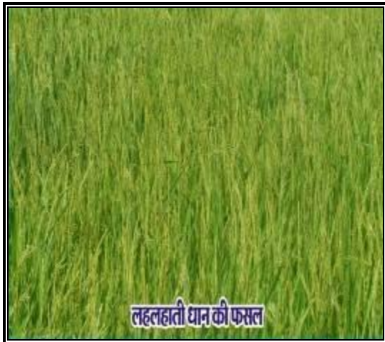
छवि 2: लहलहाती धान की फसल

bLrseky ls fufeZr cka/k dh otg ls u flQZ fdlkuksa us 60 ,dM+ {ks=Qy esa jch dh Qly cfYd cka/k ls [ksrksa rd ikuh ys tkus gsrq ukyh fuekZ.k dj [kjhQ dk Hkh mRiknu izkjaHk fd;k rFkk vius vk; esa o`f) dhA chtk[kjkZ ukyk dk ca/kku bu fdlkuksa ds thou esa ojnku ysdj vk;k gSA vkt bu fdlkuksa ds thou esa pgqavksj gfj;kyh vk xbZ gSA