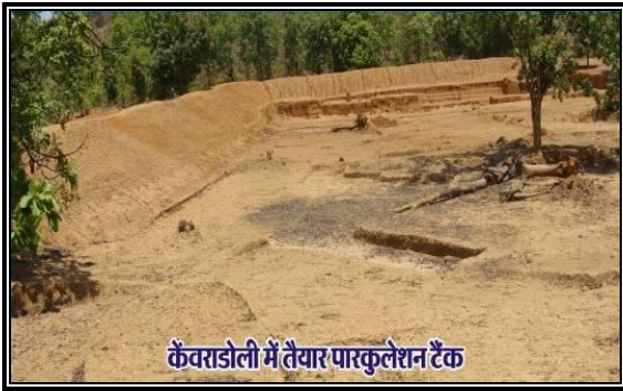
कैवराडोली में तैयार पारकुलेशन टैंक

xzke pfp;k esa 60 gtkj :i;s dh ykxr ls dq,a dk fuekZ.k fd;k x;k ftds ty dk mi;ksx mi;ksx djds panz'ks[kj flag tSls fdlkuksa us viuh ckM+h esa ICth dk mRiknu izkjaHk dj viuh thou 'kSyh esa lq/kkj fd;kA